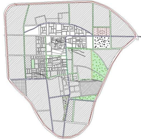
Rania Master Plan 1995