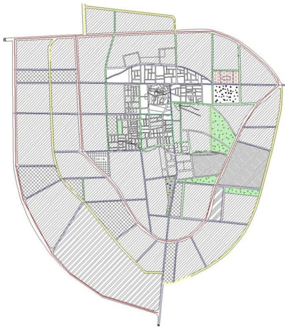
Rania Master Plan 2006