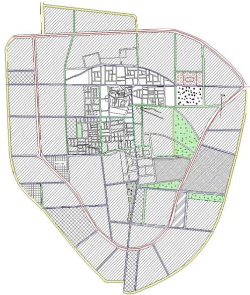
Rania Master Plan 2004